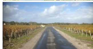
道を隔てて左がシャトー・マルゴー、右がシャトー・デ・ゼラン。